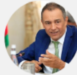
Ahmed Reda Chami Président