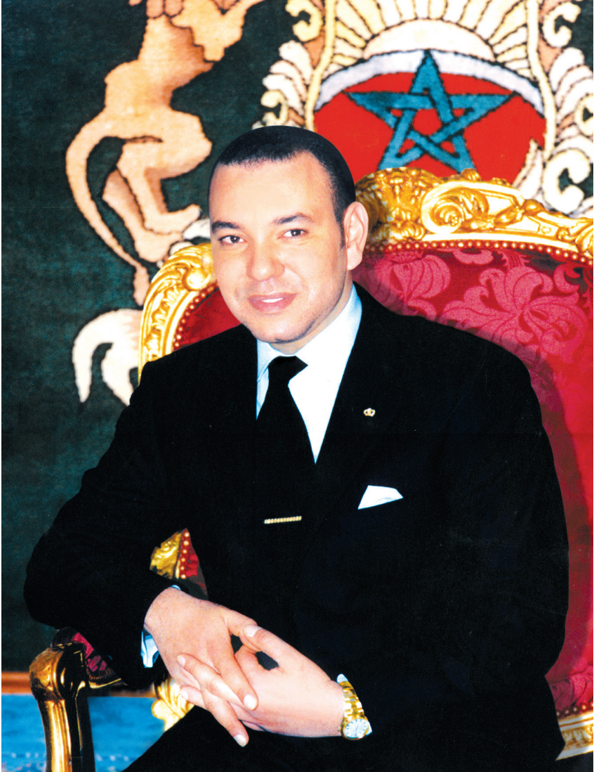
صاحب الجلالة الملك محمد السادس أيده الله ونصره